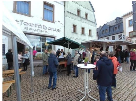
2 Fotos: Thomas Funke

Vor der Markt-Bühne genossen sehr viele Besucher das schöne Bühnenprogramm. Selbst der Osterhase war ab und an zu sehen und begeisterte nicht nur die Kinder. Es war tatsächlich eine sehr gelungene Veranstaltung für jung und alt. Auch „Udo`s Kinder-Express“ rollte unentwegt und zauberte zahlreichen Kids ein Funkeln in die Augen. „Traktorfahrt gegen Spende“ durch unsere schöne Innenstadt kam dieses Mal einer Familie zugute, welche bei einer schrecklichen Brandkatastrophe ihr ganzes Hab und Gut verloren hat. Ihr Wohnhaus wurde nahezu komplett zerstört. Respekt an dieser Stelle nochmals an die Frauen und Männer unserer Feuerwehr Meerane !!! Eure Arbeit ist in den letzten Wochen gefühlt nahezu täglich sicht- und vor allem hörbar! DANKE, dass es Euch gibt! ❤️