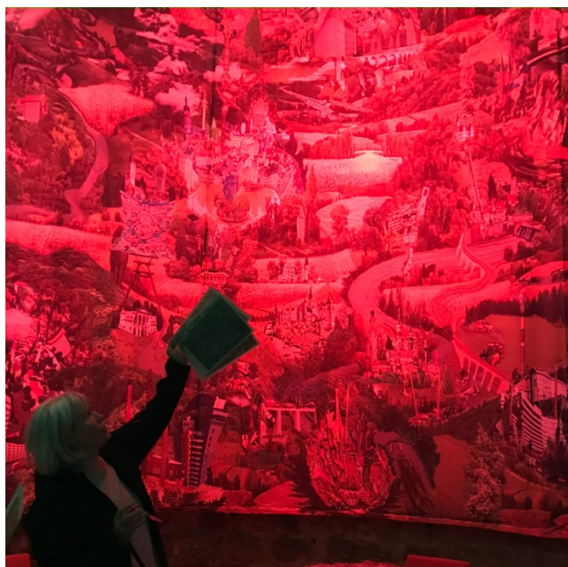
Licht und Farben simulieren den Tageslauf.

Mit den Kompositionen von Falk Zenker und Lichtinstallationen von Mario Bösemann bekommt das unendliche Rund des Paoramabildes einen dramaturgischen Rahmen.