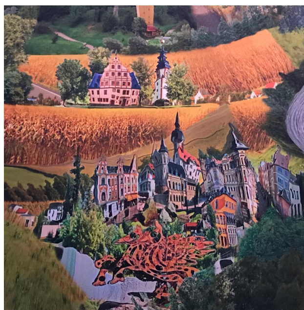
Im Bildausschnitt Meerane und Ponitz

* Öffnungszeiten des Altenburger Schlosses täglich außer montags von 9.30 – 17.00 Uhr Und am Nachmittag ab 14.00 Uhr empfiehlt sich das Café Volkstädt in der Burgstraße.