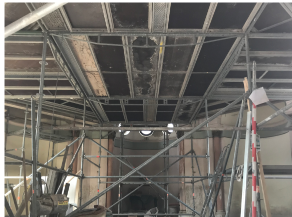
Mitarbeiter des Bauunternehmens Schuricht in der Kuppel. Noch steht das Gerüst