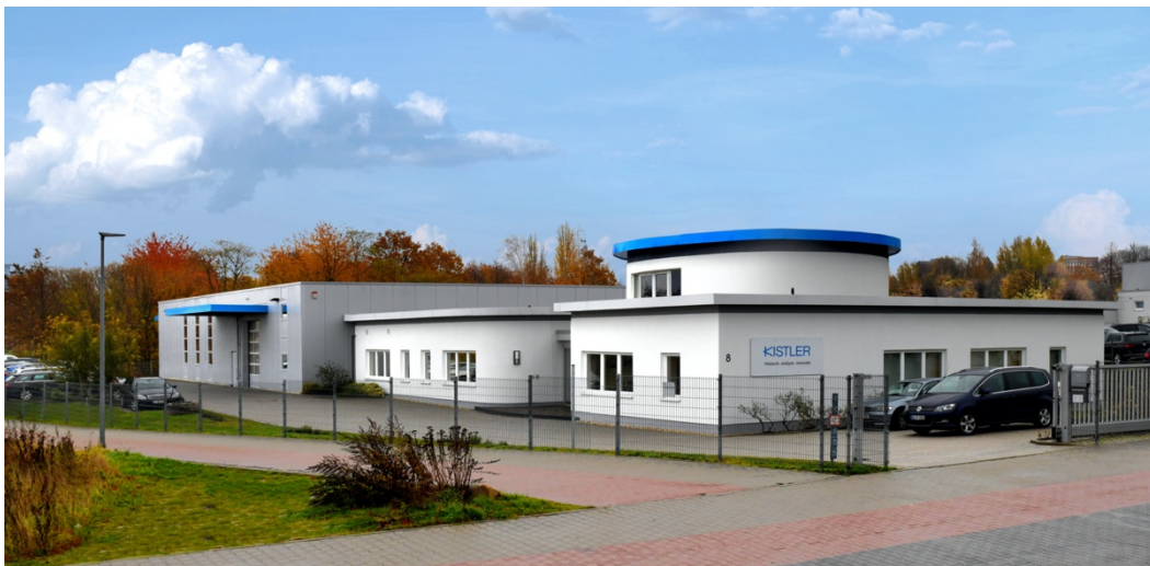
Kistler Standort in Meerane