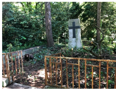
Grabstätte der Familie Pfeifer vorher und nachher