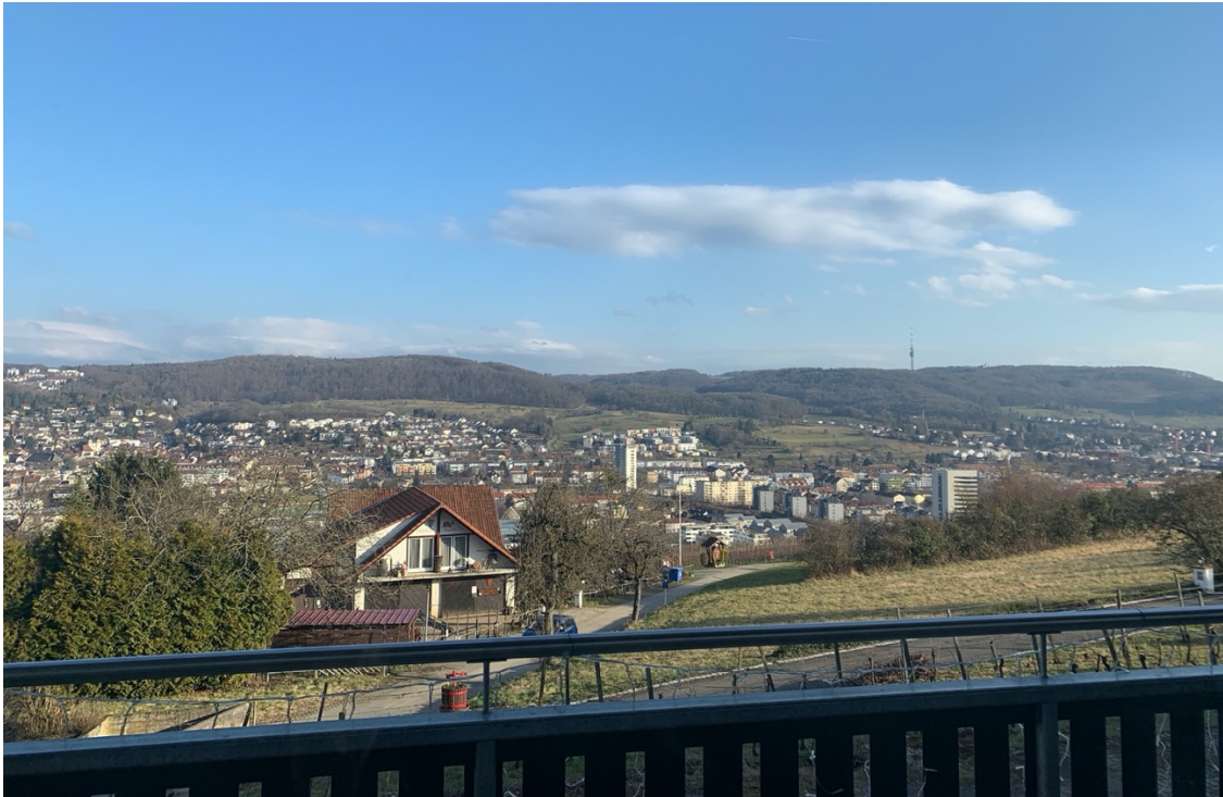
Blick vom Tüllinger Berg zum Lörracher Ortsteil Stetten

Erinnerung an unseren Besuch in der Partnerstadt Lörrach am 11.02.2022