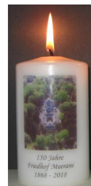
Jubiläumskerze 5 Euro