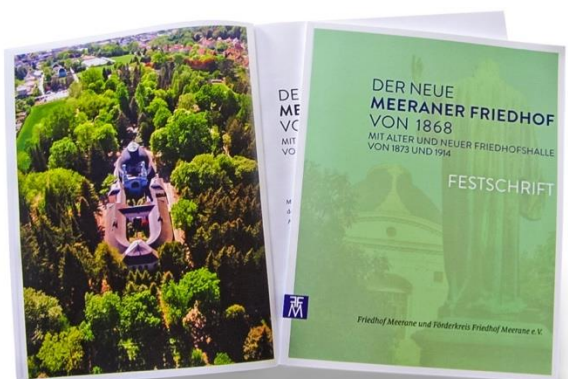
Festschrift zum Friedhofs Jubiläum Geschichte des Friedhofs, Herausgeber: Friedhof Meerane und Förderkreis 18 Euro