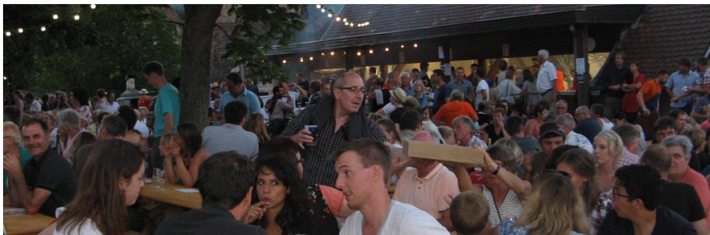
2017- zu Besuch bei Freunden – das Hunafascht im Elsass nahe Ribeauvillé