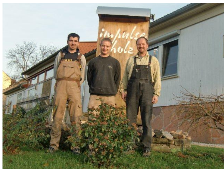
Die Tischler und der Meister

Möbel, Treppen & Innenausbau aller Art nach Ihren Wünschen