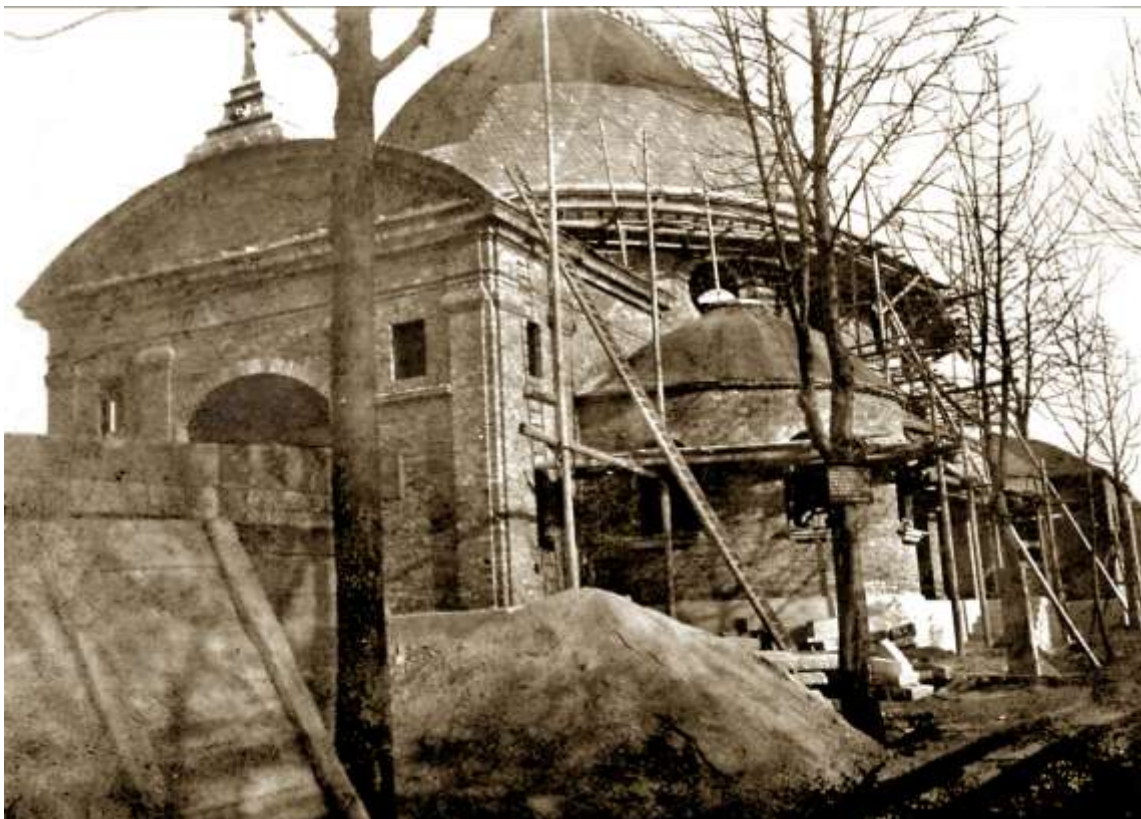
Baugerüst an der Halle im Jahr 1914. Noch gab es keine Berufsgenossenschaft.