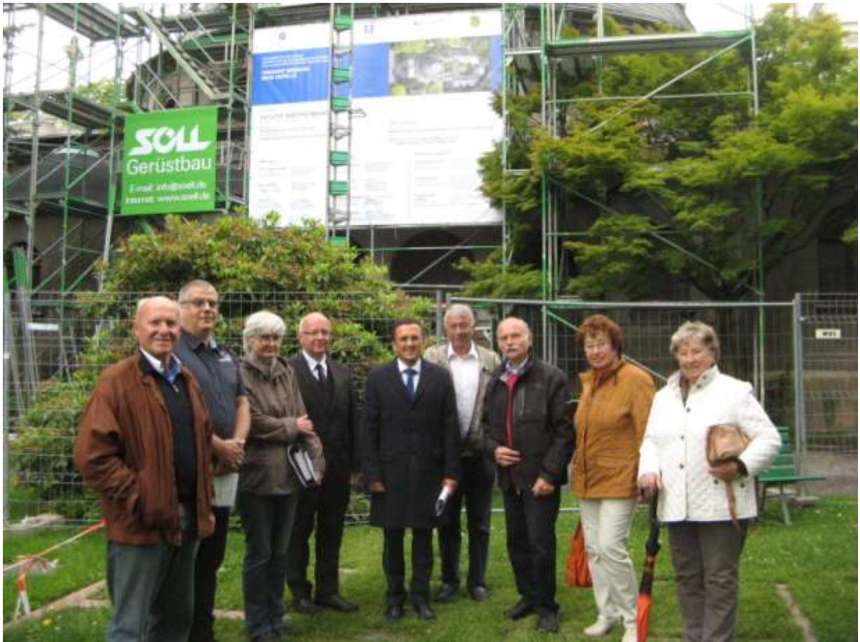
Gruppenbild vor der bereits eingerüsteten Ostseite der Halle. In der Bildmitte Bundestagsabgeordneter Carsten Körber, CDU, der sich maßgeblich für die Förderung zur Erhaltung des bedeutenden Denkmals der Reformarchitektur durch den Bund eingesetzt hat.