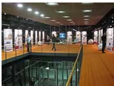
Blick in die Ausstellung

Das "Meeraner Blatt", von dem auf einer Tafel in der Ausstellung einige Ausgaben zu sehen sind, hatte keine überörtliche Bedeutung, erschien aber offenbar länger als alle anderen Neugründungen, nämlich zum ersten Mal am 18.11.89 und als gedruckte Ausgabe letztmalig am 21.06.02, herausgegeben vom Meeraner Bürgerverein und gleichzeitig als Amtsblatt. Seit 04 gibt es das Meeraner Blatt in loser Folge im Internet unter www.meeranerblatt.de . Juliane Weiss