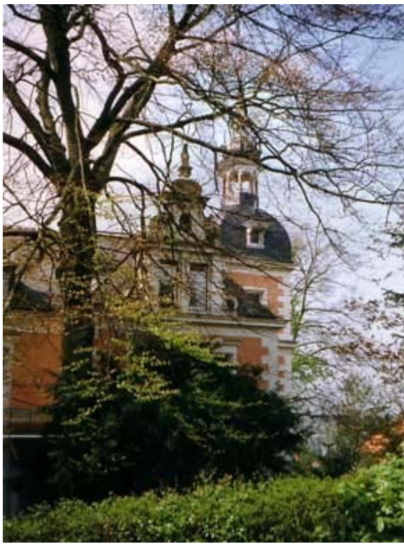
Haus von W. Wunderlich in Coburg