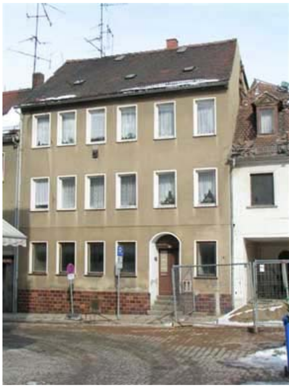
Haus von W. Wunderlich in Meerane

Die Umgestaltung des Meeraner Marktbereiches ist im vollen Gange. Viele begrüßen den inzwischen vollzogenen Abriss der Gebäude, andere trauern dem gewohnten traditionellen Stadtbild im Zentrum nach. Nun stehen die Bagger an der August-Bebel-Straße 51, die, marode, als nächstes fallen wird. Ob aber die anschließende Nr. 49 unbedingt in diese Aktion einbezogen werden muss, und ob das für die (der Öffentlichkeit noch unbekanntenen Planungen) unbedingt notwendig ist, sollte doch im Bauamt und Stadtrat nochmals gründlich überdacht werden.